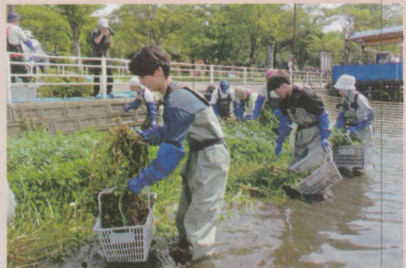
外来水生植物の刈取り